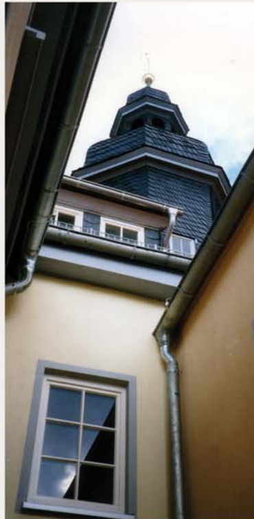
Blick zum Turm von Westen