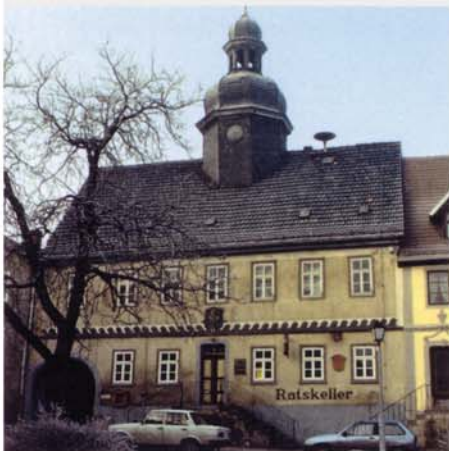
Vorzustand ca. 1993

Das Rathaus wurde laut einer Tafel in seiner heutigen Gestalt 1718 - 1728 an der Stelle eines beim großen Stadtbrand 1717 zerstörten Vorgängerbaus errichtet, welcher schon 1523 erwähnt wurde.